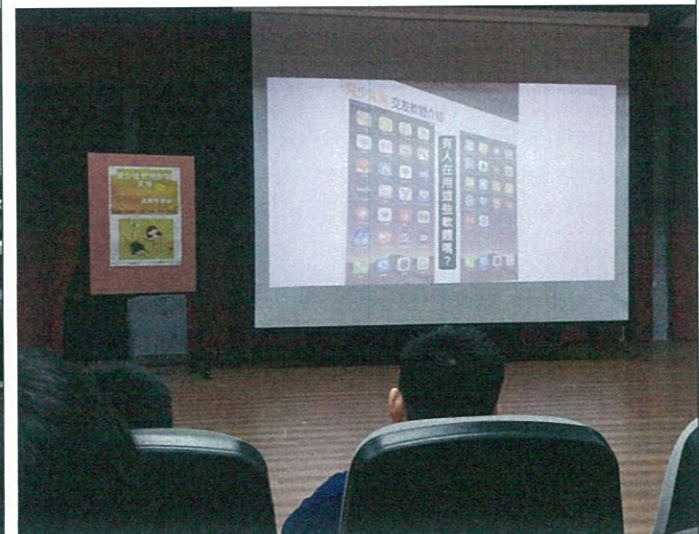
希望學生都能學會保護自己