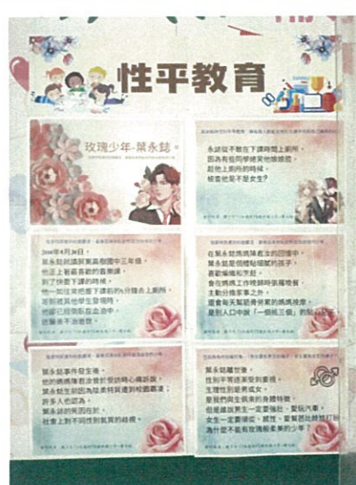
學校穿堂進行性平海報宣導