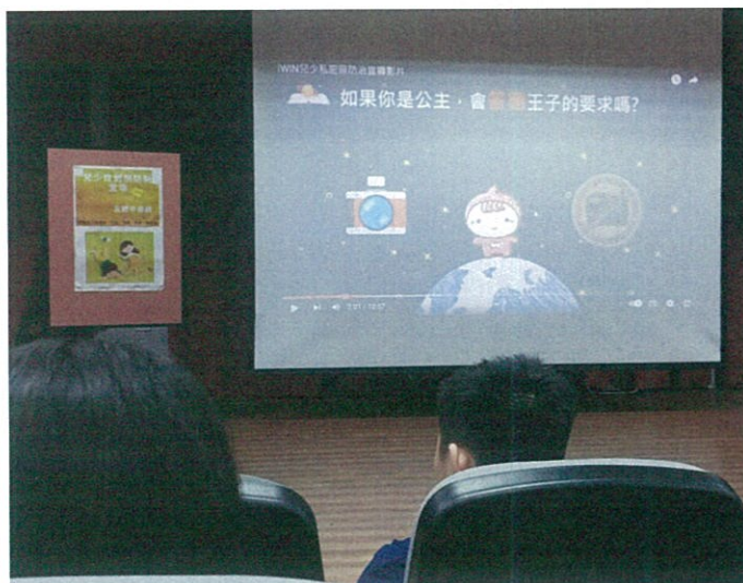
藉由影片建立兒少性剝削概念