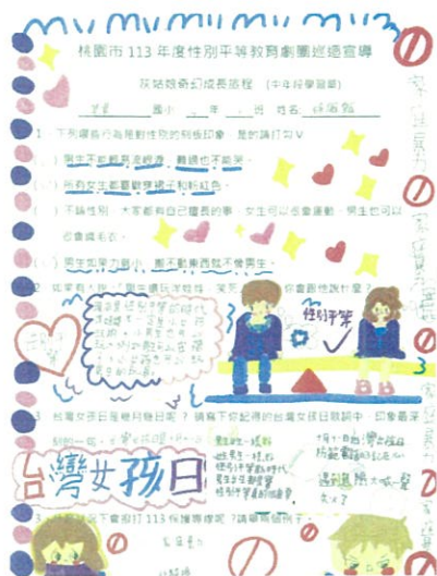
學生用心完成學習單