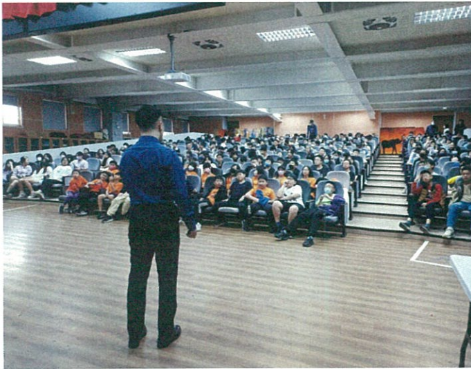
辦理高年級兒少性剝削講座