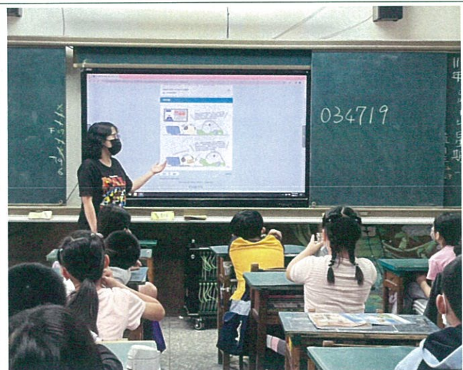
老師進行數位性別暴力問卷宣導