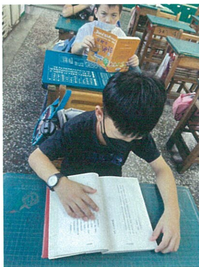
圖書導讀:穿裙子的男孩