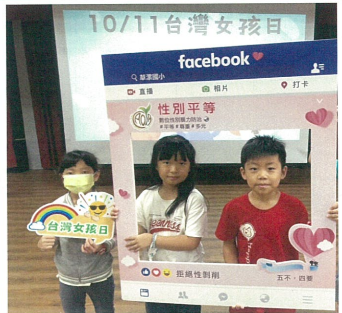
性平講座:台灣女孩日宣導