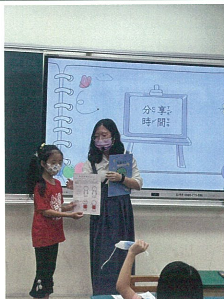
鼓勵學生勇敢說出自己感受