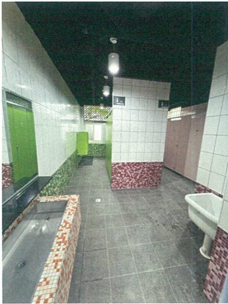
性別友善廁所完工