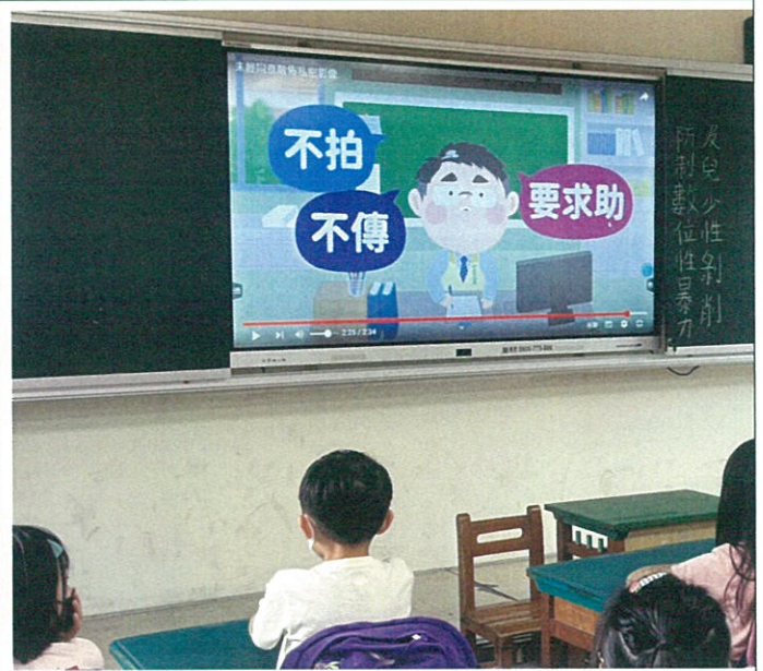
不拍不傳不分享的觀念建立