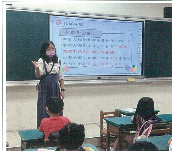
專輔教師宣導身體自主權