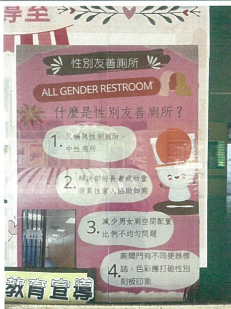
穿堂張貼性別友善廁所海報宣導