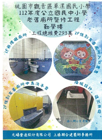
爭取經費修建性別友善廁所