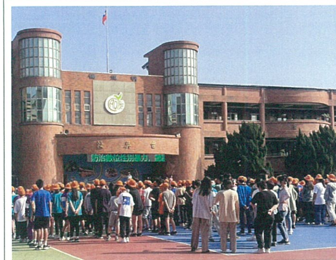
學生朝會進行防治數位性別暴力宣導