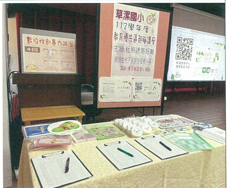
結合親職講座進行性平宣導