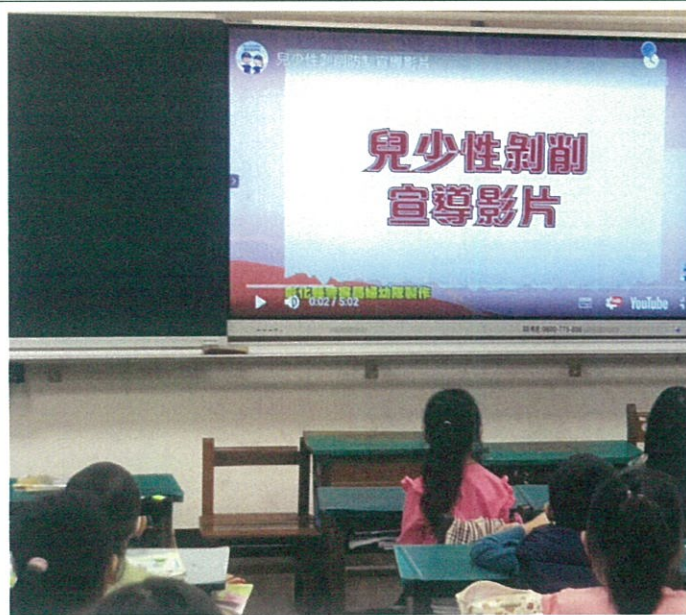
班級觀看性剝削宣導影片