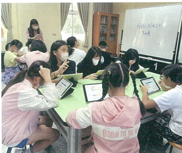
學生填寫數位性別暴力問卷調查