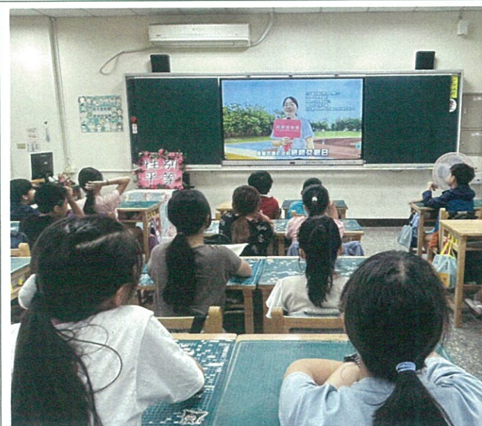
班級宣導:台灣女孩日