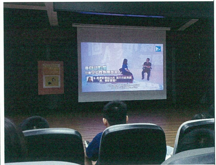
結合時事進行法律常識科普