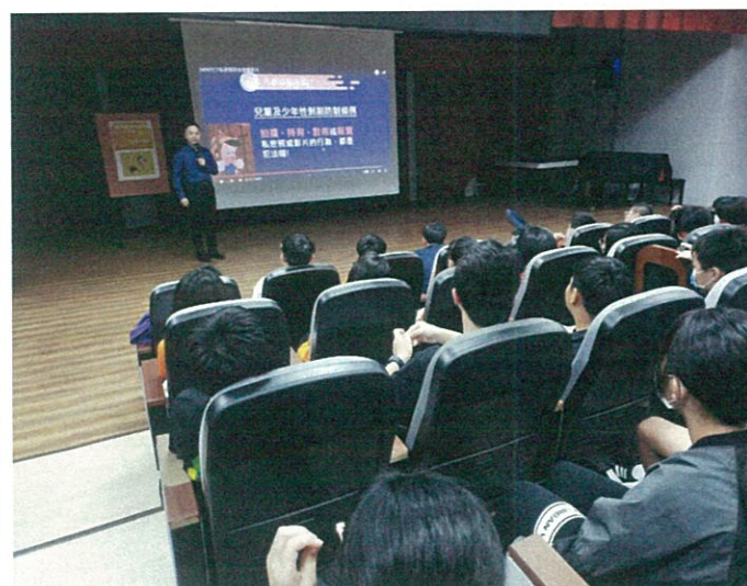
認真聆聽的學生們