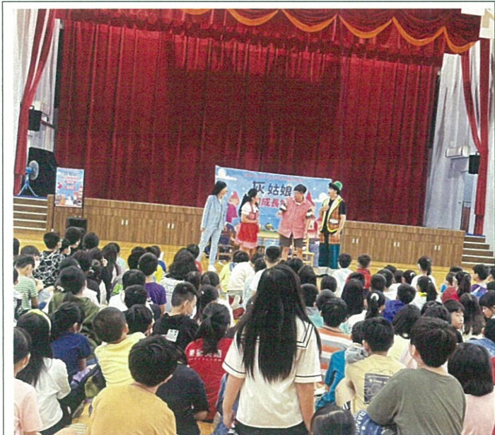
觀賞性平劇團精彩演出