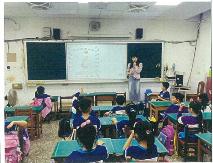
繪本分享:威廉的洋娃娃