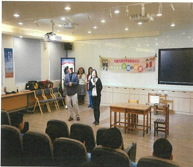
文字說明：校長性別平等教育宣導