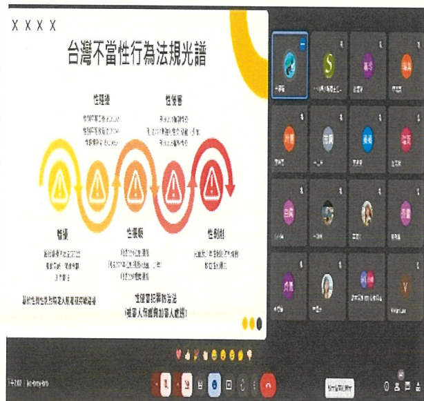
文字說明：性別平等教育宣導精彩演說