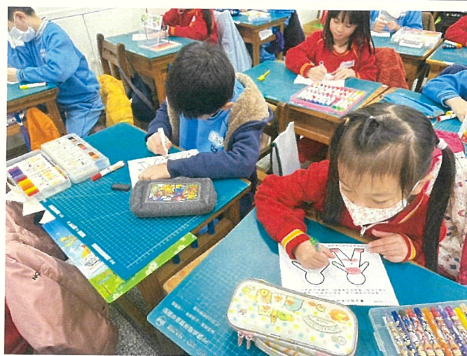
文字說明：性別平等教育入班宣導學習單習寫