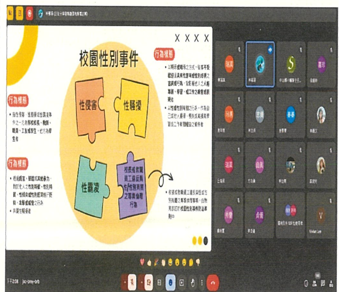
文字說明：性別平等教育宣導精彩演說容入校園