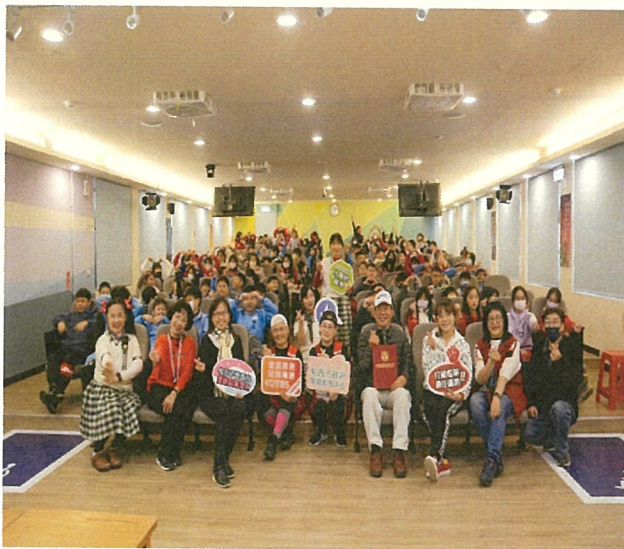
文字說明：性別平等教育宣導學生開心參與