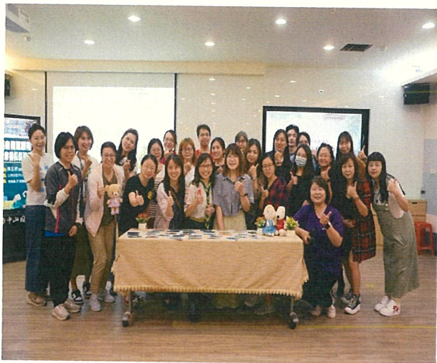
文字說明：親職講座性平教育家長熱烈參與