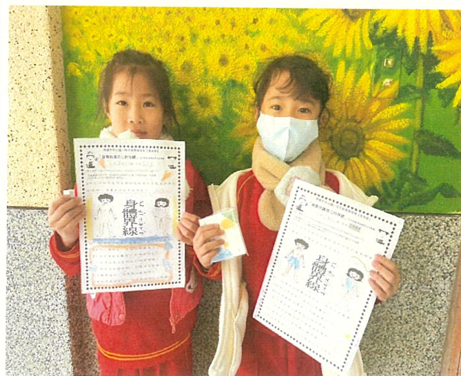
文字說明：性別平等教育入班宣導學生學習單