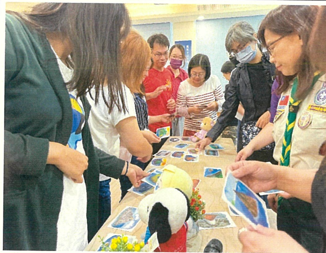
文字說明：親職講座性平教育家長熱烈參與