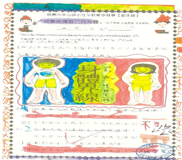
文字說明：性別平等教育入班宣導學習單