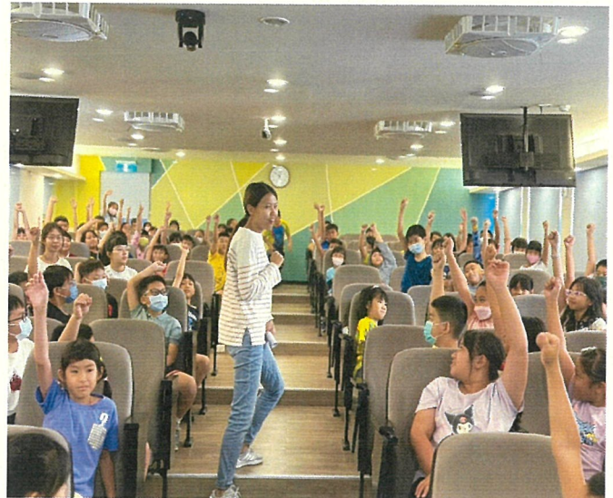
文字說明：性別平等教育宣導學生熱烈參與