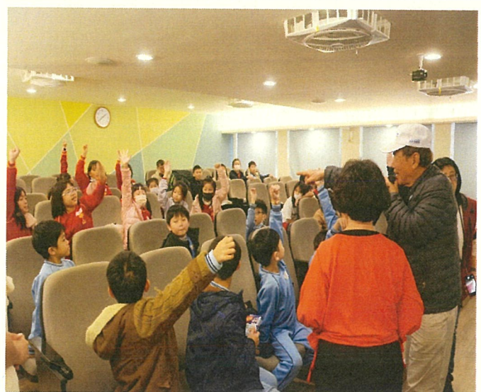
文字說明：性別平等教育宣導學生熱烈參與