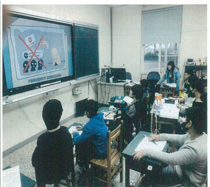
文字說明：性別平等教育宣導- 「網路不涉陷—數位性別暴力知多少？」