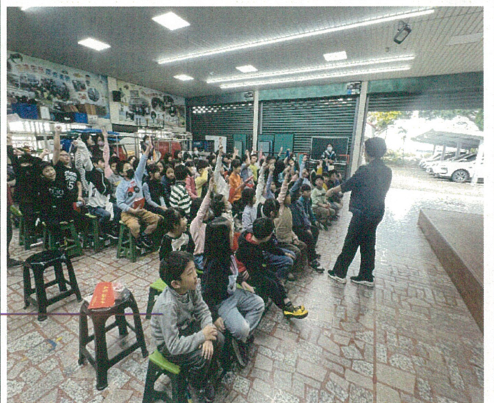
文字說明：性別平等教育宣導-有獎徵答活動