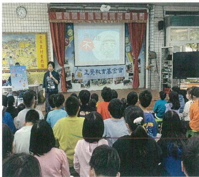
文字說明：性別平等教育宣導講座