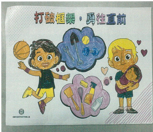
文字說明：「性別平等教育」著色比賽