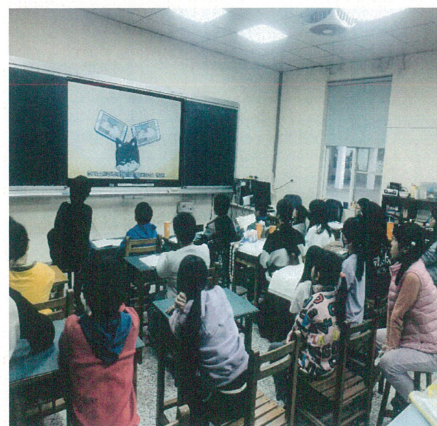
文字說明：性別平等教育宣導影片觀看- 「網路不涉陷—數位性別暴力知多少？」