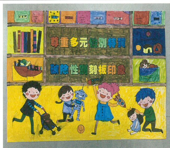
文字說明：「性別平等教育」著色比賽