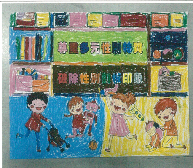
文字說明：「性別平等教育」著色比賽