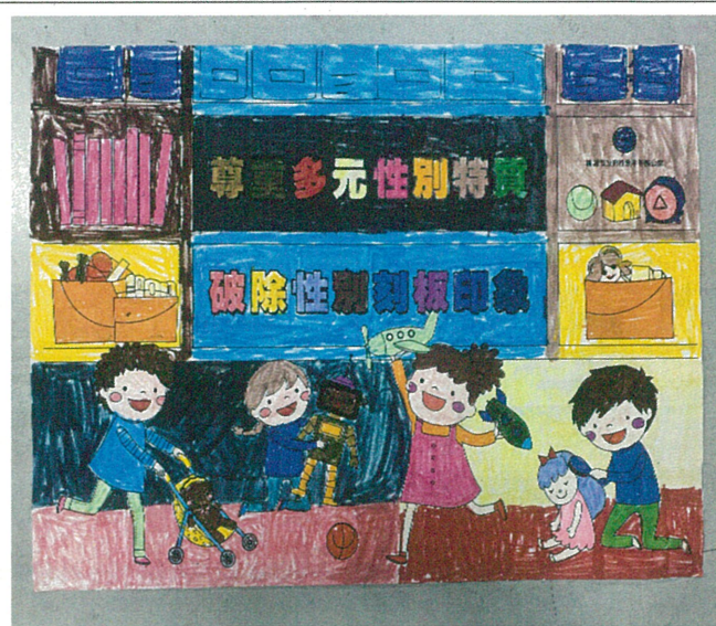
文字說明：「性別平等教育」著色比賽