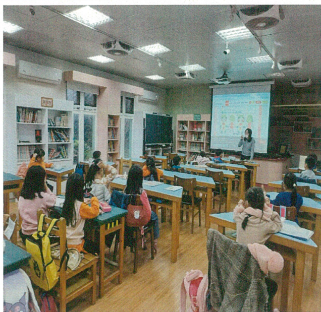
文字說明：性別平等教育宣導-認識身體界限