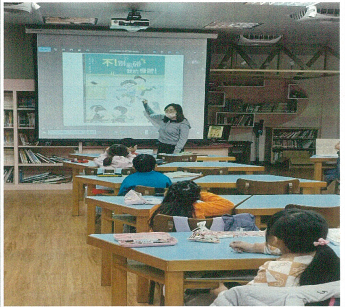
文字說明：性別平等教育宣導-認識身體自主權