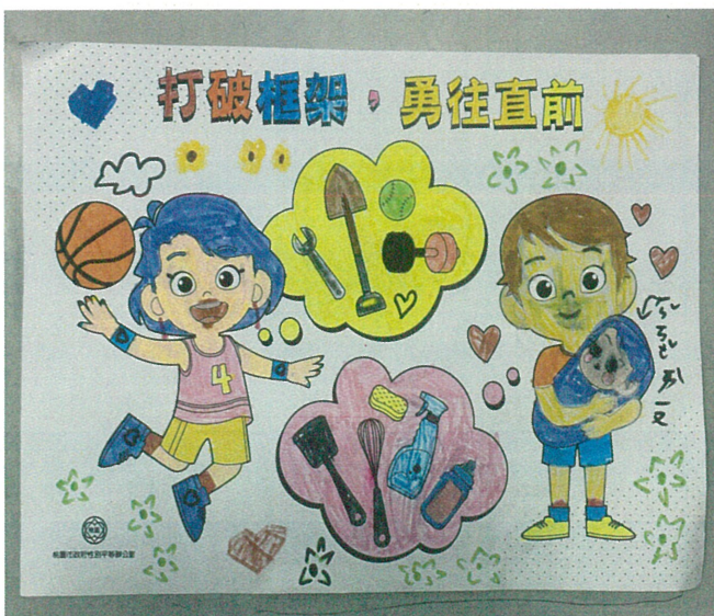
文字說明：「性別平等教育」著色比賽