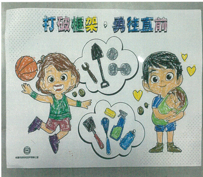
文字說明：「性別平等教育」著色比賽