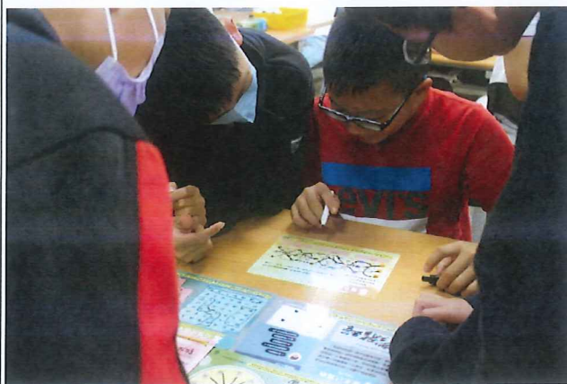
學生們專注投入遊戲解謎