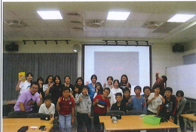
講師與學生們課程後合影的歡顏